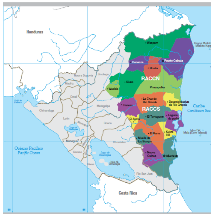
Mapa 1: Municipios de